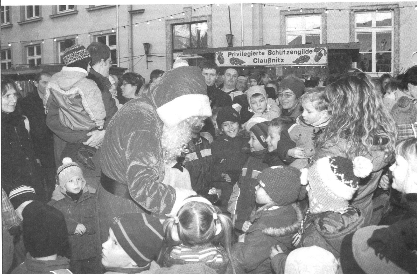
Günter Hermsdorf Bürgermeister